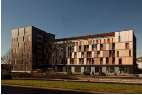
Ensemble immobilier à Aurillac, sélectionné dans le cadre de l'appel à projet bâtiments démonstrateur d'énergie, ADEME et Conseil Régional d'Auvergne 2011. 2ème Prix National de la construction bois 2014.

Grâce à un programme inégalé de conférences centrées sur l'actualité de la construction bois en France, grâce à l'espace d'exposition qui constitue un concentré de compétences, grâce à un cadre convivial qui facilite les échanges et les prises de contact, ce rendez-vous apporte au monde français de la construction bois un service essentiel à l'épanouissement de cette filière émergente du monde de la construction. Maîtres d'ouvrages publics et promoteurs, architectes, ingénieurs, économistes et maîtres d'œuvre; fabricants, industriels et fournisseurs ; constructeurs bois, charpentiers, menuisiers et entrepreneurs, chercheurs et formateurs se retrouvent au Forum qui joue ainsi son rôle de carrefour professionnel d'idées et d'affaires.