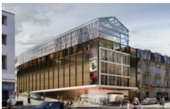
La souris verte à Epinal, ©Atelier d'Architecture Haha

Le Forum Bois Construction - FBC - s'établit les 16 et 17 avril 2015 à Nancy à 1h30 TGV de Paris-Est, ce qui est primordial pour séduire les architectes et donneurs d'ordre parisiens, d'autant que cette liaison TGV place précisément la Lorraine dans la mouvance de Paris, et réciproquement. Pour cette première édition lorraine, Epinal sera l'hôte de la journée des visites en architecture bois, le mercredi qui précède traditionnellement le Forum proprement dit. Il n'empêche que par la présence de l'ENSTIB au sein du groupe des co-organisateurs, non seulement du Forum en France, mais aussi depuis peu du grand forum IHF de Garmisch, par l'action de Gipeblor interprofession régionale et surtout par la présentation de nombreuses références au sein des dix ateliers thématiques, les Vosges et les alentours d'Epinal seront sous les feux de la rampe. Quant à Nancy, ce choix souligne en toute logique le travail de promotion de l'architecture bois effectué de longue date par l'ENSArchitecture de cette ville, notamment sous l'égide de Jean-Claude Bignon à qui sera rendu hommage en fin de première journée, tout comme au Vosgien Claude Weisrock.