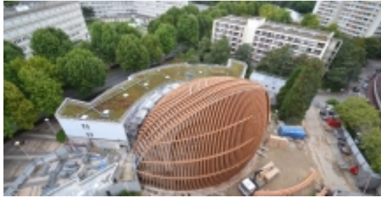
Cathédrale de Créteil. AS Architecture

Cette année, le Forum sera un grand événement français : ouverture avec Sylvia Pinel, Ministre du Logement, de l'Égalité des territoires et de la Ruralité, lancement du label Origine France Garantie-Préférez le bois français par la Fédération Nationale du Bois, présentation en clôture des pavillons bois de l'Expo de Milan dont l'exceptionnel Pavillon France.