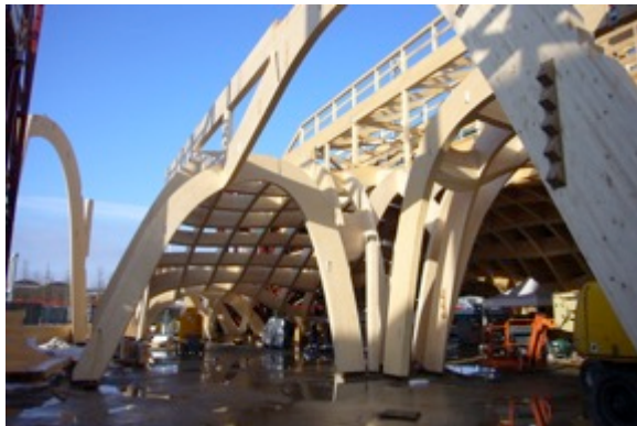
Pavillon français à l'exposition universelle de Milan, X-TU Architectes

Grâce à un programme inégalé de conférences centrées sur l'actualité de la construction bois en France, grâce à l'espace d'exposition qui constitue un concentré de compétences, grâce à un cadre convivial qui facilite les échanges et les prises de contact, ce rendez-vous apporte au monde français de la construction bois un service essentiel à l'épanouissement de cette filière émergente du monde de la construction. Maîtres d'ouvrages publics et promoteurs, architectes, ingénieurs, économistes et maîtres d'œuvre; fabricants, industriels et fournisseurs ; constructeurs bois, charpentiers, menuisiers et entrepreneurs, chercheurs et formateurs se retrouvent au Forum qui joue ainsi son rôle de carrefour professionnel d'idées et d'affaires.