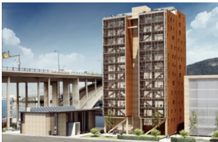
14 étages en bois à Bergen, Norvège : début février, le chantier atteint le haut débit avec quatre niveaux posés en une semaine. ©

Quant au premier 14 niveaux bois au monde, combinant une structure massive en lamellé-collé et une approche modulaire, le montage en accéléré est consultable sur internet depuis l'automne dernier mais à Nancy, les congressistes disposeront d'un premier bilan à chaud de la part du maître d'œuvre de l'opération, Rune B. Abrahamsen de SWECO Norway.